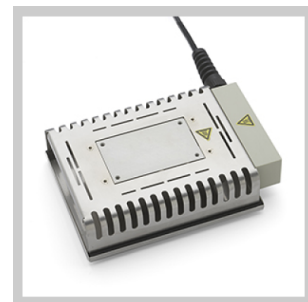
Piastre di preriscaldamento