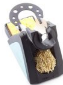
WSR201 Supporto di sicurezza

Guarda tutti i prodotti disponibili >> Stazioni saldanti Weller